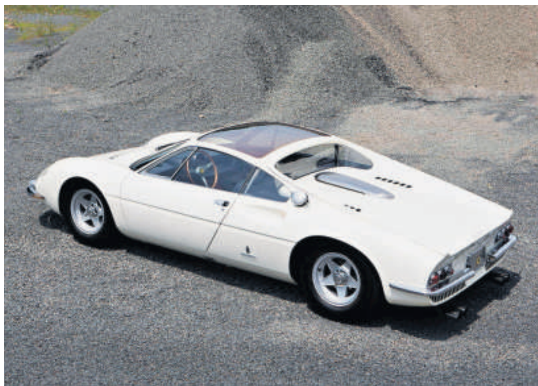
Vom dreiplätzigem Ferrari 365 P gibt es nur zwei Stück; sein Wert wird auf 10 bis 20 Mio. $ veranschlagt.

In Zürich zu sehen: Alvis TD21, mit einer Karosserie von Hermann Graber (oben) und das Einzelstück der Brüder Borghi aus Les Diablerets.